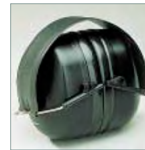
2 Sammenklappelige ørekopper

Kan foldes sammen og hænges i bæltet. Så de altid er indenfor rækkevidde, når man har brug for dem.