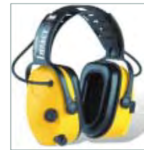
3 Elektroniske høreværn

Kan foldes sammen og hænges i bæltet. Så de altid er indenfor rækkevidde, når man har brug for dem.