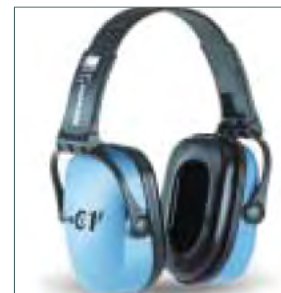
1 Normalt standard høreværn

Ørekopper slides, bøjlen kan blive slap og tætningsringen kan ødelægges. Høreværn skal være velholdte og de skal altid bæres, når støjen er der.