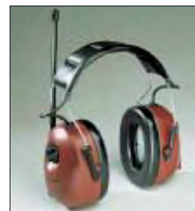
4 Høreværn med radio

For mange er det motiverende at have radio i høreværnet, så kan man høre radio samtidig med at man beskytter sig. Radioen kan normalt højst skrues op på 82 dB(A).